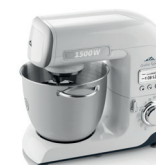
GRATUS KULINER ETA0038