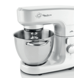
MENO ETA0030 MEZO ETA0033