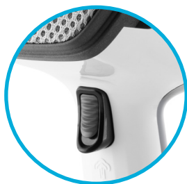
Tlačítko na výstup páry s aretací