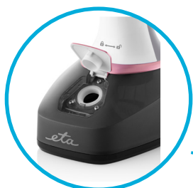
Odnímatelná nádržka na vodu pro snadné plnění