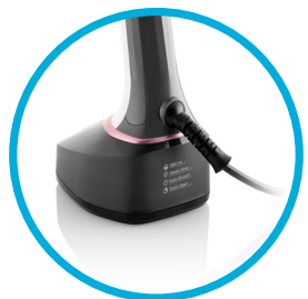
Výkyvná vývodka napájecího kabelu