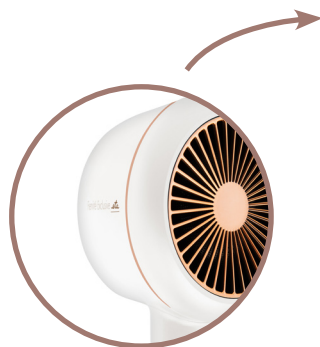
Tepelně izolovaný plášť / nástavce