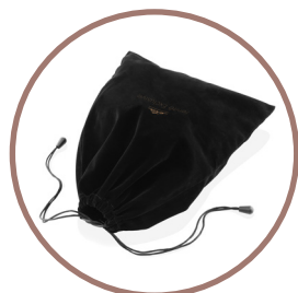
Ochranný cestovní pytlík