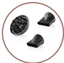
3 nástavce: 2x koncentrátor otočný o 360° a difuzér