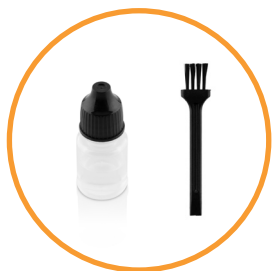
Čistící štěteček, olej a cestovní pouzdro