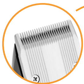
Odnímatelná zastříhovací hlava s nerezovým ostřím