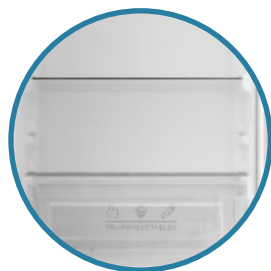
Skleněné police Transparentní dveřní přihrádky