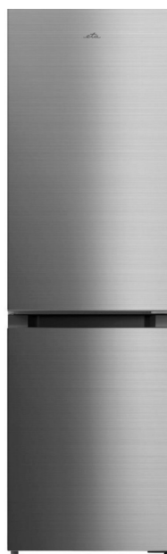
Výškově stavitelné nožky